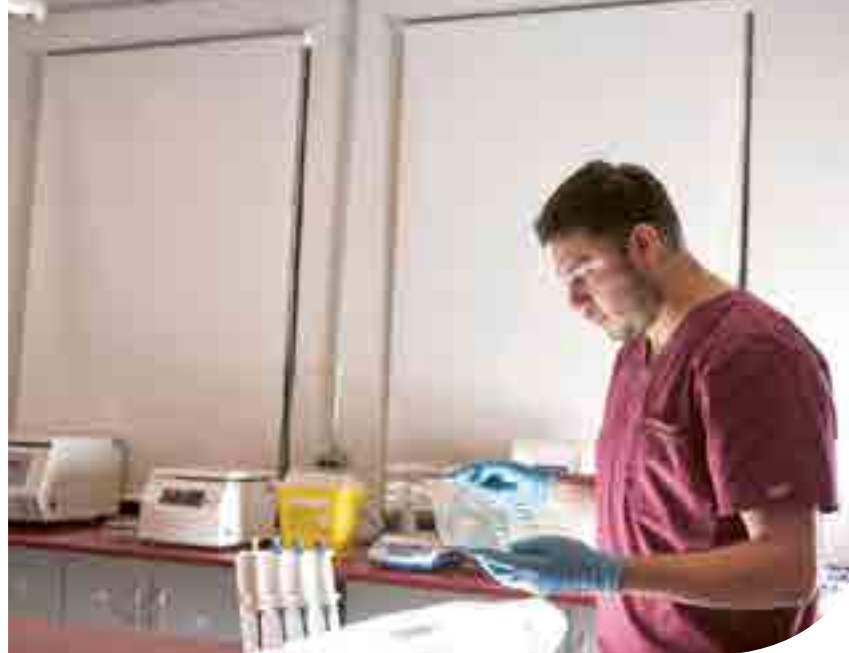
Mención Laboratorio Clínico, Hematología y Banco de Sangre