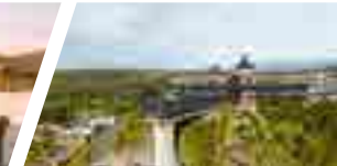
Campus Puerto Montt, Sede De la Patagonia.