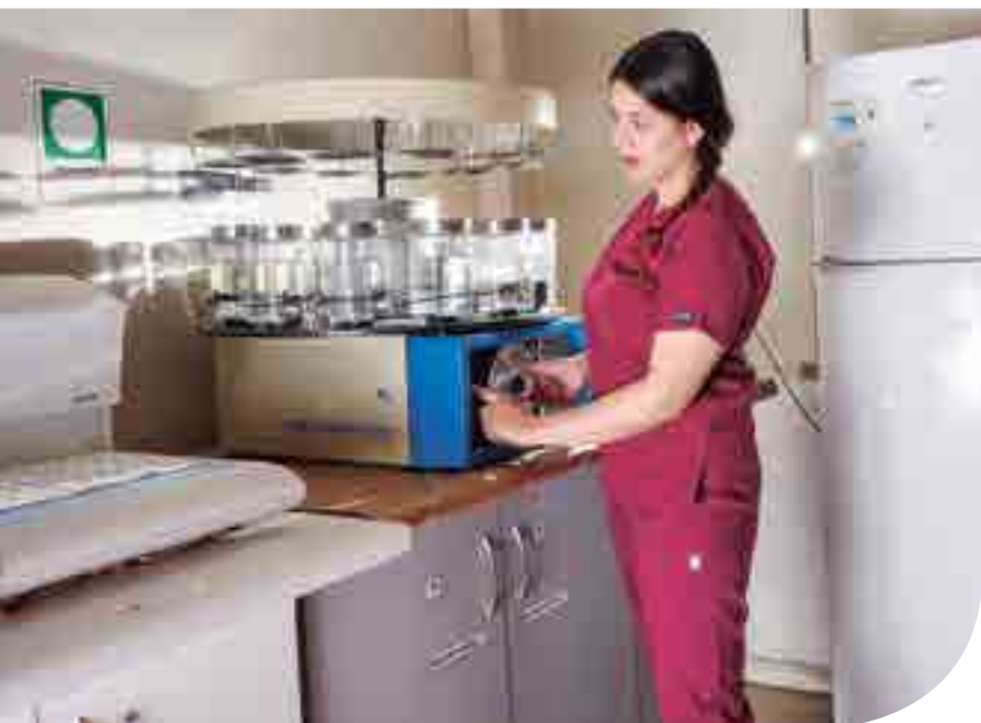
Mención Morfofisiopatología y Citodiagnóstico