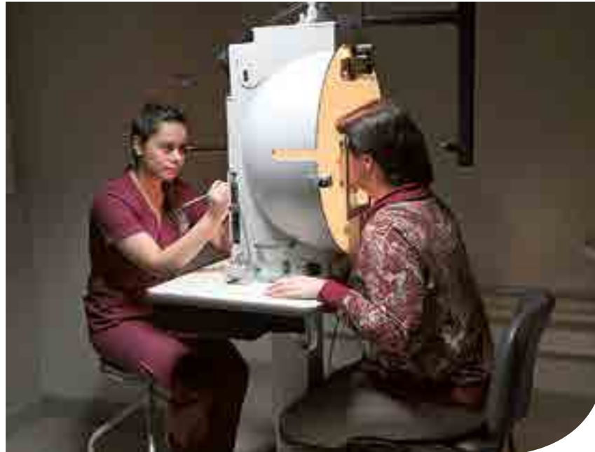
Mención Oftalmología y Optometría