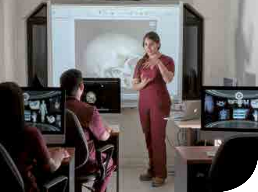
Mención Imagenología y Física Médica