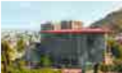
Campus Bellavista, Sede Santiago.

Folleto actualizado en noviembre de 2019. Válido para Admisión 2020.