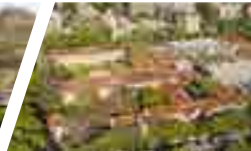
Campus Los Leones de Providencia, Sede Santiago.