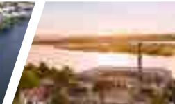
Campus Valdivia, Sede Valdivia.