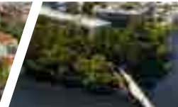
Campus Las Tres Pascualas, Sede Concepción.